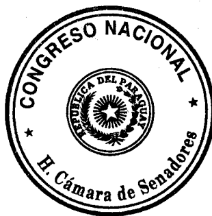
Blas Antonio Llano Ramos Presidente H. Cámara de Senadores

A Su Excelencia Pedro Alliana Rodríguez , Presidente Honorable Cámara de Diputados Poder Legislativo