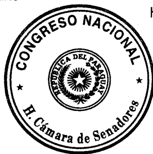
Blas Antonio Llano Ramos Presidente H. Cámara de Senadores

A Su Excelencia Señor Mario Abdo Benítez Presidente de la República Poder Ejecutivo